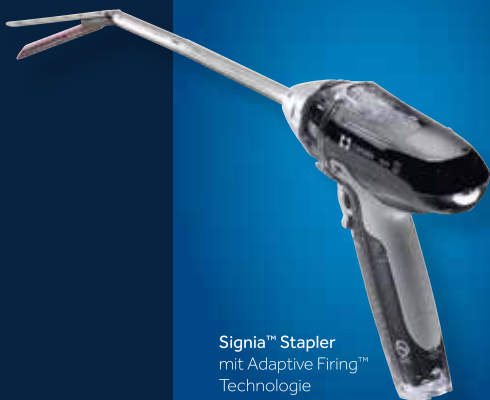
Signia™ Stapler mit Adaptive Firing™ Technologie

Das weltweit erste intelligente Klammernahtsystem mit Real-Time Feedback.